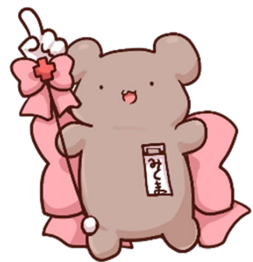
社会医療法人三車会 公式キャラクター 「みくまくん」