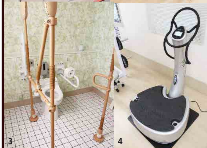
1 浴槽シュミレーター、2 レッグプレス 3 手すりの位置を替えられるトイレ、4 パワープレート

2014年12月20日に新棟建設の地鎮祭が執り行われはよいもので10か月が過ぎました。その間、地域の皆様入院・外来の患者様には物資の搬入、工事車両の往来や騒音等で過大なるご迷惑をおかけしましたが、おかげをもちまして、リハビリテーション病院の名に恥じない、県下では最大規模のリハビリテーション施設が完成しました。このリハビリテーション室は「みくるま通信春号」でもご紹介した通り、ワンフロアに各専門エリアがあり、患者様の移動による負担を軽減し、セラピスト間の連携を高め患者様の情報を共有し、ご自宅に退院していただくことを目標に、その病状に応じたリハビリテーションプログラムを提供することができます。PTエリアは県下でまだ数台しか導入されていないパワープレートをはじめ最新の運動療法機器や物理療法機器を用いて展開します。OTエリアはIADL(手段的日常生活活動能力)を高めるためマルチパスエリアを設け、調理実習室、浴槽及び浴室評価システム和室などで在宅復帰、復職、復学に向け必要な作業やパソコン操作の練習も行われます。リハビリテーション室の中に車いすで入れる広い身障者トイレが設置されており、その方に合った手すりやペーパーホルダーの位置を決め、それを住宅改修に反映したり、介助者に実際の介助方法を指導することも可能となりました。また、近年料理療法が認知症患者様に効果があると報告されていることもあり積極的な調理実習室の活用を考えています。STエリアは個室を3部屋設置し静かな環境でプライバシーに配慮し高次脳機能障害、摂食・嚥下障害の検査、評価を実施し、必要に応じて訓練、指導、助言を行います。国の施策である地域包括ケアシステムに則り、「攻めのリハビリ」に「生活」と「社会参加」を加味したリハビリテーションを展開します。個々の知識・技術を高め日々研鑽し、さらに発展する貴志川リハビリテーション病院にご期待ください。