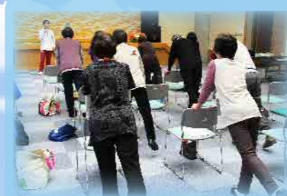
膝痛予防体操の風景