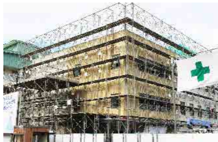
ようやく防音シートがはずれ外観が姿を現しました。