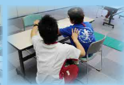
セラピストによる個別指導

認定調査を受けられていない方は、当院へ一度ご連絡頂ければ、ご利用までの流れをご説明させていただきます。