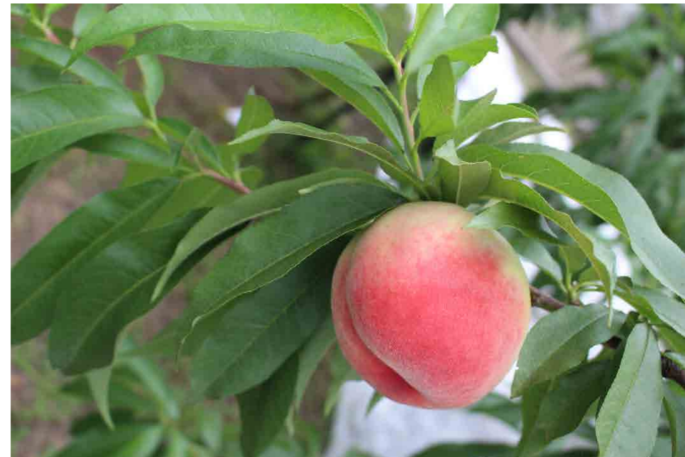
撮影場所：紀の川市の桃 / タイトル：「桃色」

7月より地域連携室が患者サポートセンターに変わり、新たな体制で患者様の支援をさせていただきます。