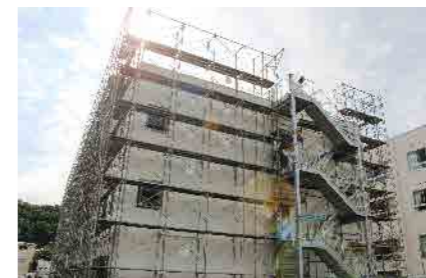
反対側は非常階段が設置されています。