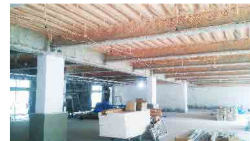
屋内初公開です！こちらは駐車場になります。