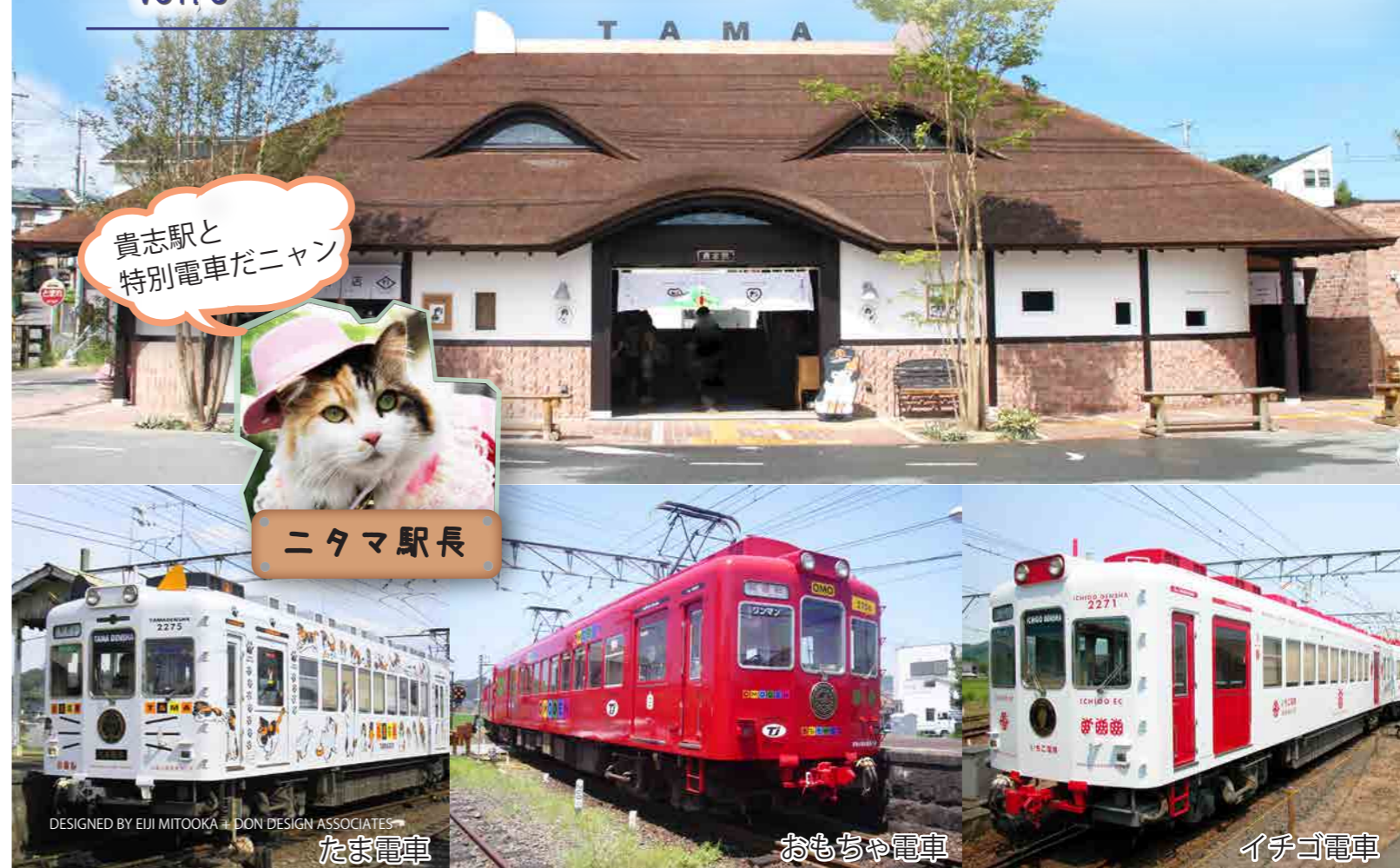
貴志駅から当院まで車で約10分