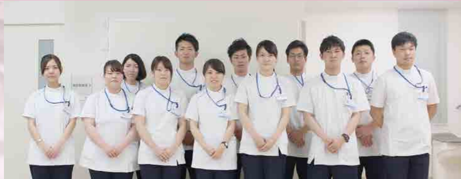
言語聴覚士 1名 作業療法士 2名 理学療法士 8名 助手 1名