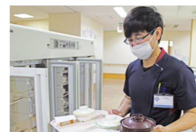
食事の配膳を行う様子

A. 和歌山城に花見に行ったとき、桜の木の下でお酒を飲んだり、ご飯を食べたりするのを見て驚きました。日本の文化は不思議に思うことがたくさんあります。またいつか北海道に行って雪景色を見てみたいです。