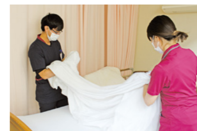
シーツ交換もきっちりテキパキ

私は外国人なので、患者さんの言葉が理解できなかったり、自分の言いたいことをうまく伝えられないことがあり、コミュニケーションで困ることがあります。