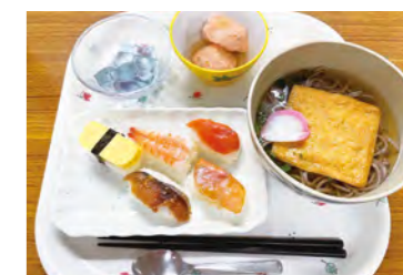
赤ひげで提供している食事

理学・作業療法士が一人一人の利用者様の評価を行うことで状態を把握し、個別リハビリや動作練習、筋力トレーニングなど、個々の状態に応じた専門性の高いプログラムを行っていただきます。また、訪問リハビリと同様に日常生活動作のみならず社会参加レベルでの改善ができるようになるためにもアプローチを行っていきます。