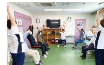
デイケアのリハビリの様子