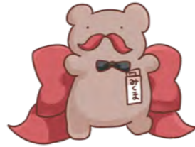
公式キャラクターみくまくん (赤ひげバージョン)