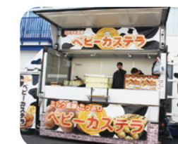
やまびこキッチン様