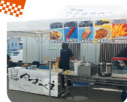
らっぱのやすべえ様