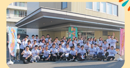
みくるま祭り実行委員会より

これからも地域の皆さまとともに、さらに盛り上げていきたいと考えております。また来年のご参加を、心よりお待ちしております。